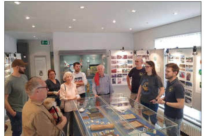
Teilnehmer bei der Ausstellungseröffnung

Des Weiteren weist der Kanu-Club Kelsterbach auf die Jubiläumsregatta hin, die am Samstag, den 18. Mai stattfinden wird. Hierzu können Firmen und Vereine Teams mit 8 Personen bis zum 01. Mai unter der E-Mail-Adresse regatta@kck1924.de anmelden, hier werden auch Fragen zur Regatta beantwortet. Über eine rege Beteiligung würden sich die Vereinsmitglieder sehr freuen.