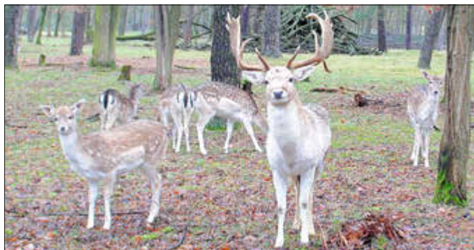
Damwild lebt in Rudeln.