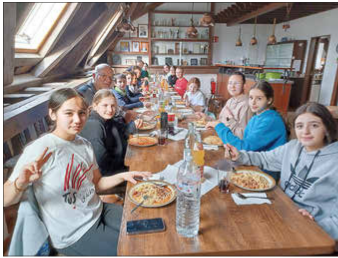
in der „Kantine“ Hinkelstein beim Stärken!

An beiden Tagen war um 12 Uhr die Mittagspause angesetzt. Gemeinsam spazierten sie zum Vereinshaus Hinkelstein, wo sie von Hilde sehr gut verköstigt wurden.