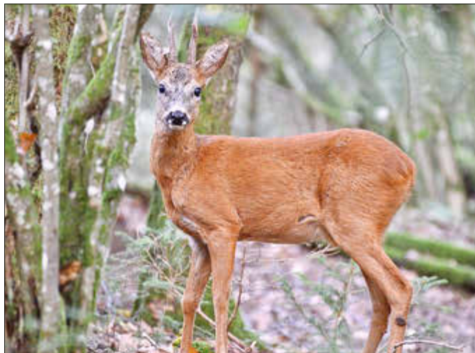
Rehböcke tragen ein deutlich kleineres Geweih als Hirsche.