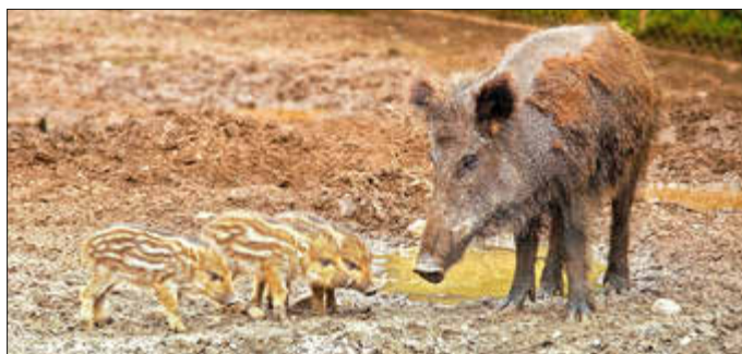
Wildschwein-Frischlinge haben ein unverwechselbar gestreiftes Fell.

gesetzt, wie viele Tiere jährlich geschossen werden sollen, um die Wilddichte im Kelsterbacher Stadtwald ökologisch und wirtschaftlich tragfähig zu halten. Dass die Stadt Kelsterbach Damwild hegt, ist übrigens keine Selbstverständlichkeit, sondern eine bewusste politische Entscheidung. Die Stadt wolle ihren Bürgerinnen und Bürgern die Möglichkeit eines besonderen Naturerlebnisses ermöglichen, sagt Klepper. Wer sich also in den Stadtwald begibt, hat vielleicht Glück und kann Hirsche, Rehe und andere Tiere in freier Wildbahn beobachten. Die Naturfreunde sollten aber unbedingt auf den Wegen bleiben und auf keinen Fall in die dicht bewachsenen Dickungen, wo die Tiere ihre Versteck- und Schlafplätze haben, eindringen. Das gereicht zum einen den Tieren zum Schaden, zum andern zieht dieser Verstoß aufgrund geltender Jagd- und Naturschutzgesetze ein Bußgeld nach sich, wenn man dabei erwischt wird. (wö)