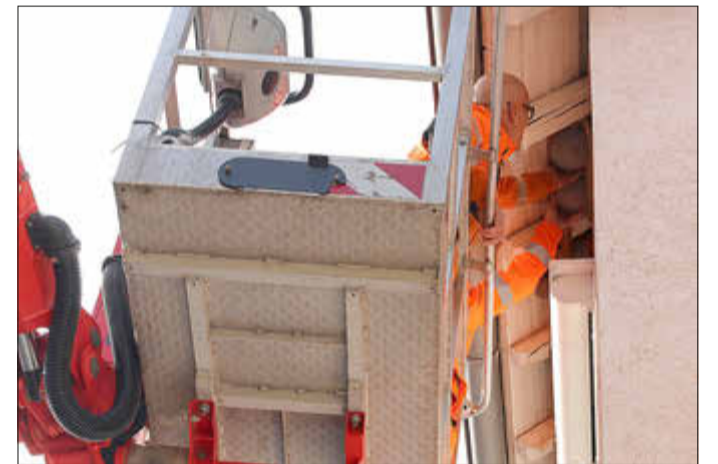
Mit Hilfe eines Hubwagens brachten Mitarbeiter des KKB die Nisthilfen an.