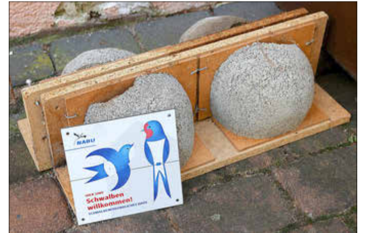
Für das Anbringen von Nisthilfen gab es vom NABU die Auszeichnung „Schwalbenfreundliches Haus“.