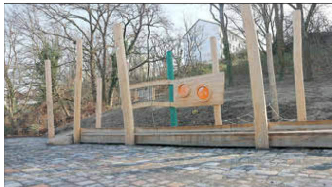
Neben Klettern und Rutschen gibt es auch ein Klangspiel auf dem Spielplatz Mainhöhe.