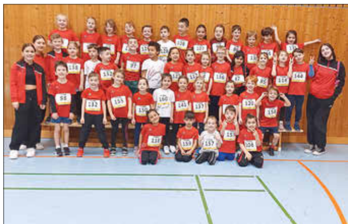
„Mannschaft U 8!“

Nach diesen drei Disziplinen trat eine Pause ein, da die Halle für die Biathlon-Staffel umgebaut werden mußte. Zuschauer und Sportler konnten sie durch den reichhaltigen Verpflegungsstand gut überbrücken. Gut gestärkt traten die Kinder wieder in ihren Mannschaften an. Sie mussten eine große Runde in der Halle durchlaufen, dabei eine dicke Weichmatte überqueren, am „Schießstand“ galt es Hütchen abzuwerfen. Traf man nicht, musste eine Strafrunde um einen großen Mattenberg absolviert werden und konnte erst dann den nächsten Mannschaftskameraden abklatschen. Hier stieg das Stimmungsbarometer gewaltig an, denn es galt die Teamkameraden zu Höchstleistungen anzuspornen.