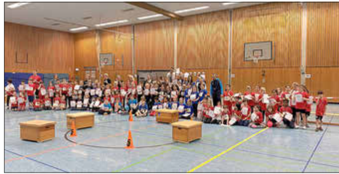
„und alle waren Sieger der U 10!“