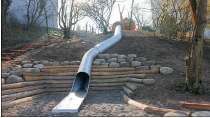
Eine lange Rutsche führt vom oberen Teil des Spielplatzes über den Hang in den unteren Bereich.

neu geplant und umgebaut, um die Lebensqualität zu verbessern und den Anwohnerinnen und Anwohnern eine Naherholung in der Natur zu ermöglichen. Am Donnerstag, 14. März, soll schließlich die große Einweihung des Spielplatzes Mainhöhe stattfinden.