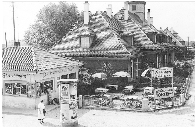
Gaststätte Lindenhof mit Kiosk, fotografiert von Richard Siebart.

tern und aufs Neue zugänglich zu machen. Neben den bereits ausgestellten Bildern gibt es 50 weitere Fotos zu bestaunen, die das Stadtgeschehen in den 50er und 60er Jahren des vergangenen Jahrhunderts zeigen. Die Ausstellung ist von Sonntag, 3. März, bis Sonntag, 24. März, zu sehen. Das Stadtmuseum in der Marktstraße 11 ist sonntags von 15 Uhr bis 17 Uhr geöffnet. (cs)