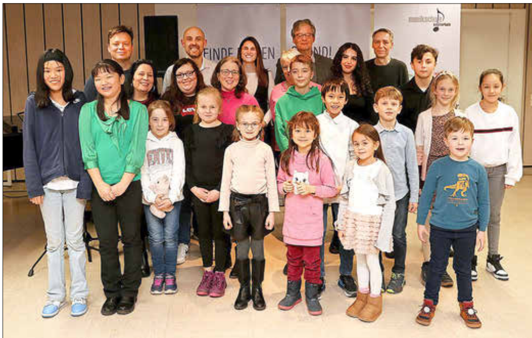
Die stolzen Teilnehmerinnen und Teilnehmer des ersten Schülervorspiels 2024.