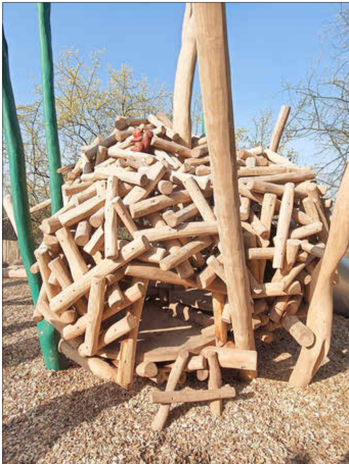
Hereinspaziert: Einem Eichhörnchenkobel nachempfunden ist der Spielbereich an den die lange Rutsche anschließt.