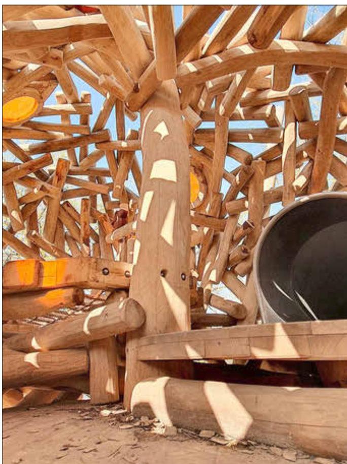
Im Spiel-Kobel ist alles lichtdurchflutet und trotzdem gemütlich wie in einem Nest. Verstärkt wird dieser Effekt durch orangene Scheiben, die warme Lichtreflexe entstehen lassen.