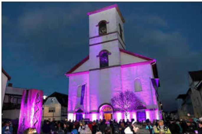
Zum Jubiläum wurde die St. Martinskirche stimmungsvoll illuminiert.

In diesem Jahr feiert die St. Martinskirche im Unterdorf ihr 200-jähriges Kirchweihjubiläum. Die Gemeinde blickt auf zwei Jahrhunderte voll Geschichte und Geschichten, voll Traditionen und Veränderungen zurück. Aus diesem Anlass gab es am vergangenen Wochenende verschiedene Jubiläumsveranstaltungen, mit denen die Bedeutung der Kirche und ihrer Gemeinde für die Stadt gewürdigt wurde.