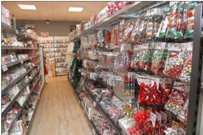
In den Gängen des Ladens kommt auch schon Weihnachtsstimmung auf.

Das neue Woolworth-Kaufhaus in Kelsterbach ist eines von über 50 in Hessen – Tendenz steigend. Zu finden ist es am Graf-de-Chardonnet-Platz und hat montags bis samstags von 9 Uhr bis 19 Uhr geöffnet. (sb)