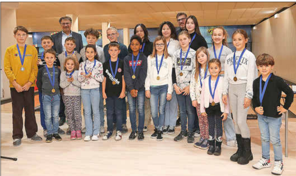
Auch beim TuS gab es viele hervorragende Leistungen zu würdigen.