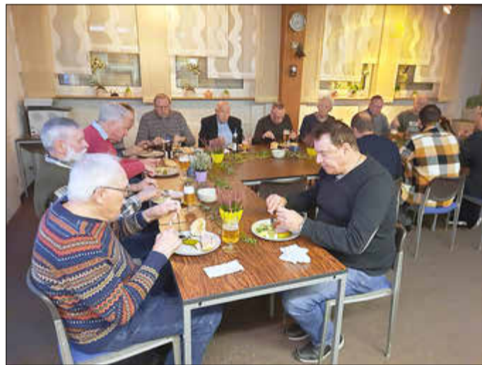
Das Essen schmeckt in großer Runde

Neben alkoholfreien Getränken waren Fassbier und Äpfelwoi im Ausschank.