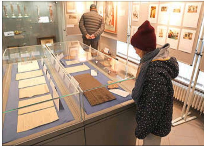
Im Stadtmuseum wurde eine Ausstellung zum Jubiläum der St. Martinskirche eröffnet.