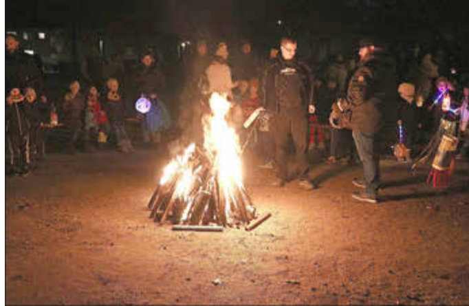
Das Martinsfeuer wurde auf dem Schlossplatz entzündet.