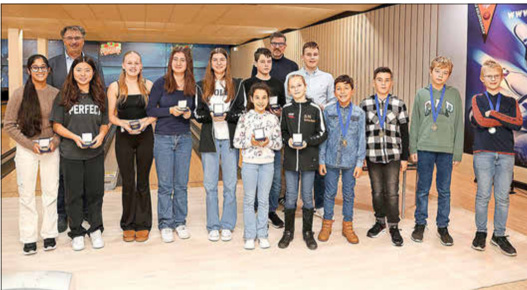
Der Nachwuchs von der DLRG freute sich über die Auszeichnungen.