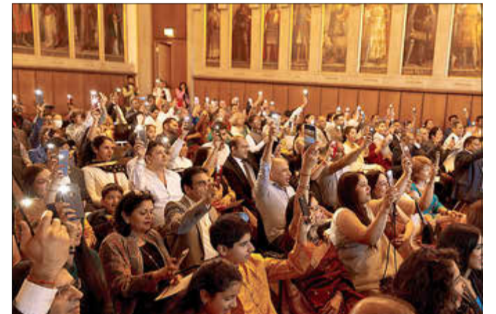
Diwali Empfang im Frankfurter Römer 2022

Für weitere Informationen stehen Repräsentanten der Stadt Kelsterbach und des KfK Fördervereins gerne zur Verfügung. Wir laden Sie herzlich ein, an diesem geschichtsträchtigen Abend teilzunehmen und darüber Ihren Freunden zu berichten.