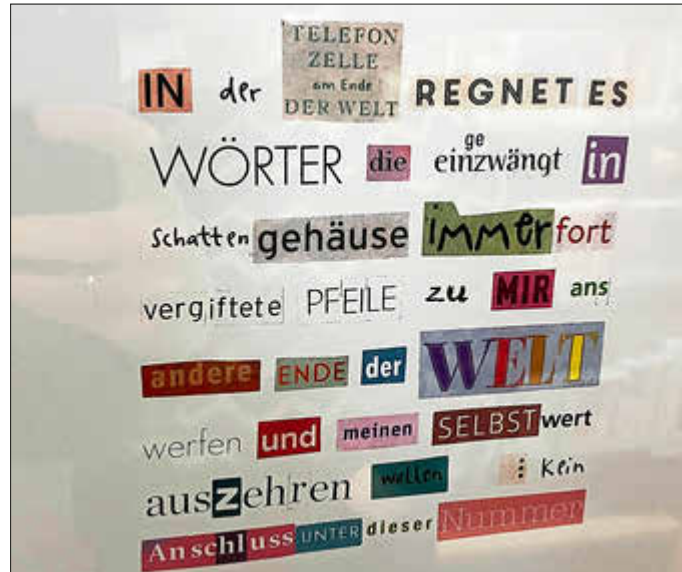
Eine von 37 ausgestellten Wortcollagen.