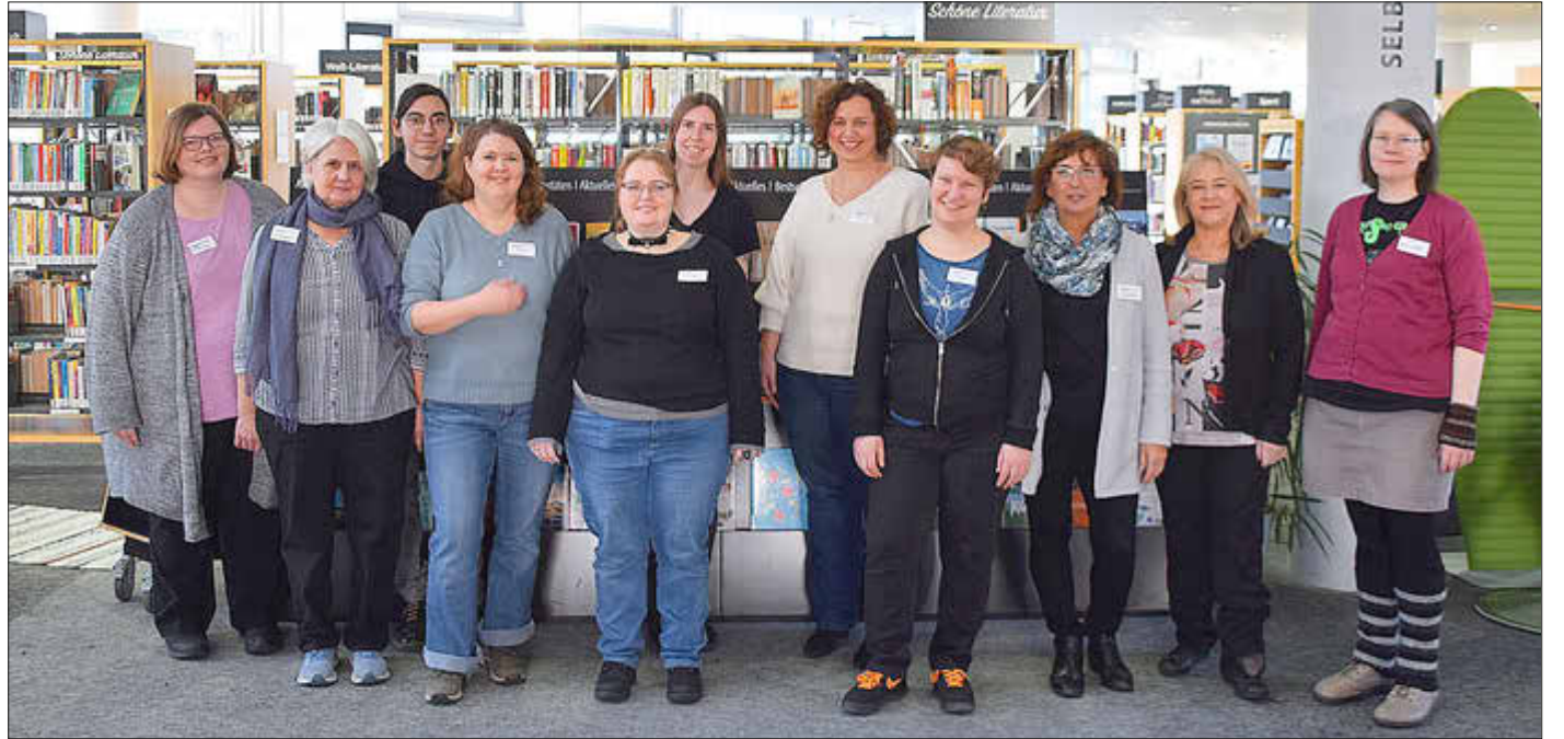
Das gesamte Bibliotheks-Team freut sich, Besucher ab sofort auch am Dienstagvormittag empfangen zu können.

Änderung gibt es auch für den Donnerstagvormittag: Dort verkürzt sich die Öffnungszeiten von bislang 12.30 Uhr auf 12 Uhr. Somit lauten die neuen Öffnungszeiten der Stadt- und Schulbibliothek ab sofort wie folgt: Montag geschlossen, Dienstag 8 Uhr – 12 Uhr und 14 Uhr – 18 Uhr, Mittwoch 14 Uhr – 18 Uhr, Donnerstag 9.30 Uhr – 12 Uhr und 14 Uhr – 19 Uhr, Freitag 14 Uhr – 18 Uhr. (sb)