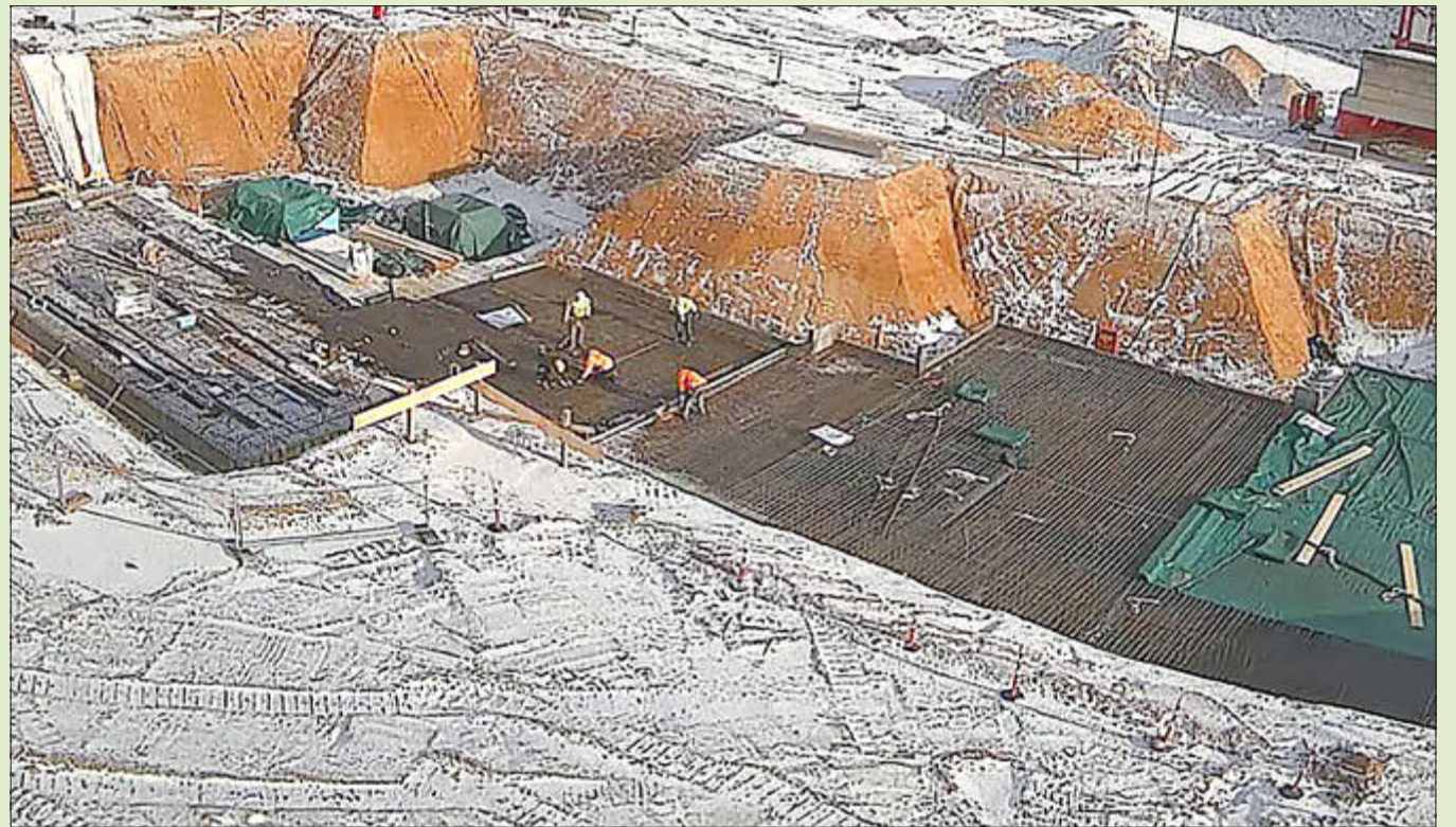
Eine Webcam zeigt ab sofort den Baufortschritt der neuen KTS.

Seit dieser Woche gibt es einen besonderen Service für alle, die an der Entstehung der neuen Karl-Treutel-Schule (KTS) interessiert sind. An dem Anfang Januar auf dem Baufeld aufgestellten, 30 Meter hohen Baukran wurden von dem ausführenden Generalunternehmer Hochtief Webcams angebracht, die Live-Bilder von den Arbeiten an dem Schulneubau liefern. Neben einer Galerie mit aktuellen Aufnahmen gibt es auch ein Zeitrastervideo zu sehen, das den Baufortschritt eindrucksvoll verdeutlicht. Zu sehen sind die Aufnahmen auf der Seite https://neubau-kts-kelsterbach.de/ . Dort finden sich auch Neuigkeiten rund um den Neubau, Informationen und Pläne zu dem Projekt sowie die Gewinnerbilder vom Malwettbewerb, an dem im vergangenen Herbst alle Schülerinnen und Schülern der KTS teilgenommen hatten. (sb)