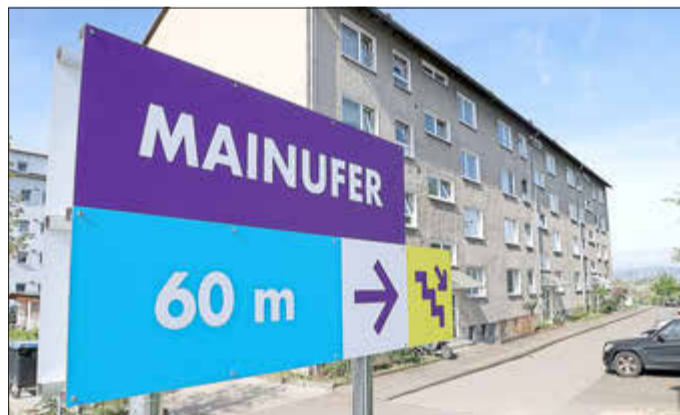
Ein neues Schild weist den Weg zum Treppenabgang, der zum Mainufer führt.

In der Rüsselsheimer Straße steht seit kurzem vor Haus Nummer 149 ein Wegweiserschild, das auf den zum Mainufer führenden Treppenabgang hinweist. Wer sich dorthin begibt, kann nicht nur einen schönen Blick über den Main genießen, sondern, sofern er die Treppen hinabsteigt, ein neues Graffiti bewundern, das im Rahmen eines Jukos-Workshops in den Osterferien dort entstanden ist. Unter der Leitung