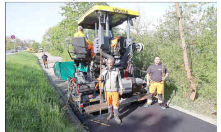
Vergangenen Freitag brachten Mitarbeiter der Firma Peter Gross Bau den Asphalt auf.

Die Stadt Kelsterbach hat einen 176 Meter langen und drei Meter breiten Abschnitt eines Radweges, der außerorts zwischen der Kreuzung Rüsselsheimer Straße / Okrfelder Straße und der Unterführung Rüsselsheimer Straße verläuft und zum Regionalpark-Routennetz im Südwesten gehört, mit einer neuen Asphalt-