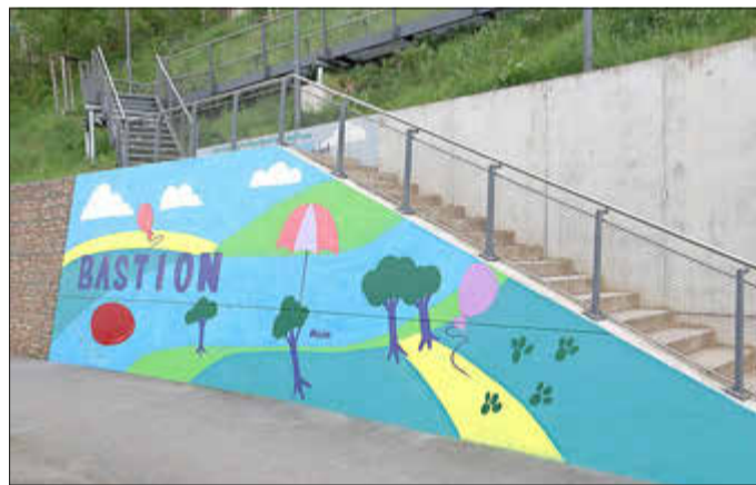
Ein farbenfrohes Graffiti verschönert die Mauer an der Bastion.