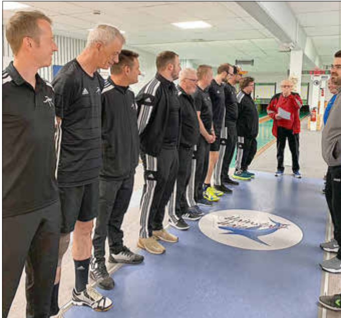
Die SG Herren 1 beim letzten Saisonspiel in Hainstadt.

SG Kelsterbach 1 schafft den Klassenerhalt Platz 6 in der Hessenliga B gesichert