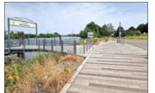
Der Landungsplatz in Rüsselsheim ist das Ziel der Radtour.

der Mönchhofkapelle, das Mainvorland in Raunheim und das Rüsselsheimer Klärwerk, das besichtigt wird. Das Ende der Radtour ist gegen 17 Uhr eingeplant. Wer mitfahren möchte, muss ein eigenes Fahrrad mitbringen und sich zuvor bei der Kulturregion Frankfurt RheinMain per E-Mail an rdik@krfrm.de oder unter Telefon 069 25771761 anmelden. Informationen zur Radtour gibt es auch auf der Website www.krfrm.de/veranstaltungen/wasser-verbindet . (wö)