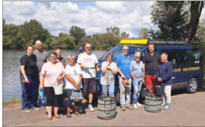
Die fleißigen Helfer des Kanu-Club Kelsterbach

Fest, das am Samstag, den 19. August stattfinden wird, folgen dann die Aufbauarbeiten. Zug um Zug werden eine Bühne, Zelte und letztlich Sitzgarnituren und Verpflegungstheken aufgestellt. Wenn dann am 19. August um 15 Uhr das Fest eröffnet wird, warten leckeres Essen, Live-Musik, Cocktails und Getränke, Paddeln auf dem Main und alles, was der Verein sonst noch zu bieten hat, auf die Besucher. Die vielen Helfer des Kanu-Club Kelsterbach hoffen natürlich auf gutes Wetter und reges Interesse in der Bevölkerung, damit sich der Aufwand lohnt und auch das Sommerfest 2023 ein Erfolg wird.