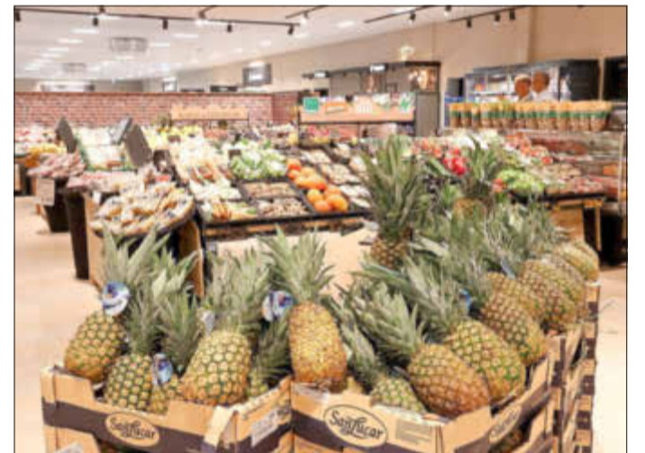
Frische Ananas und andere leckere Obstsorten warten auf die Kundschaft.