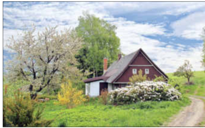
Wunderbar idyllisch - und Standortangepasst.

Wie geht ein klimaangepasster Wohlfühlgarten?