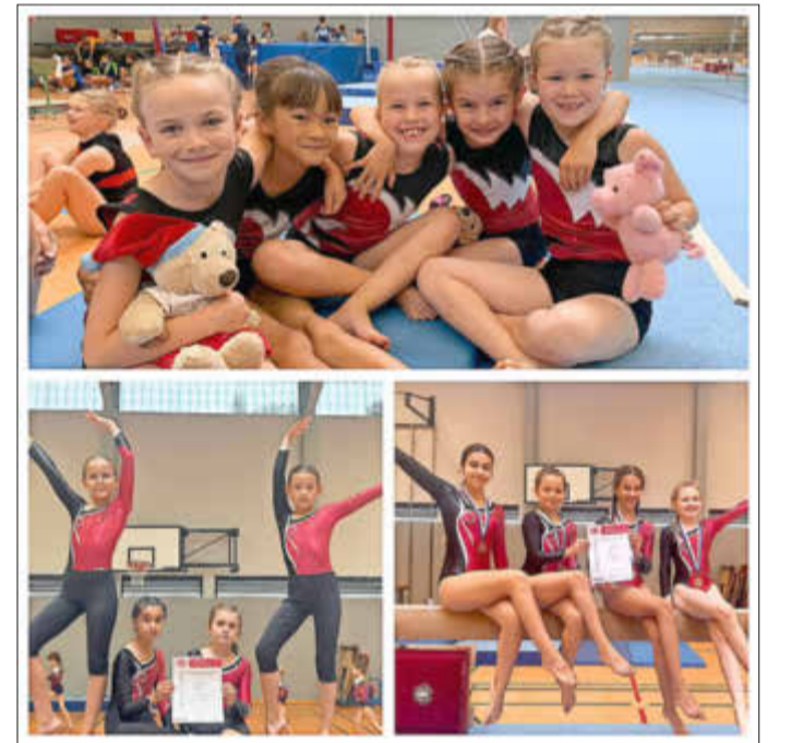
„Die erfolgreichen TuS-Turnerinnen!“