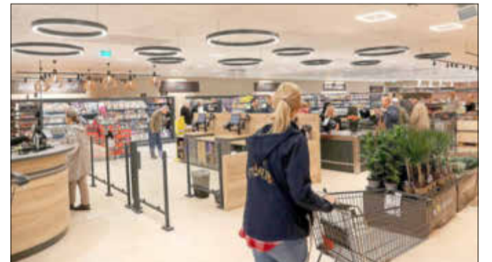
„Modern und lichtdurchflutet“ lautet die zutreffende Beschreibung eines Kunden.