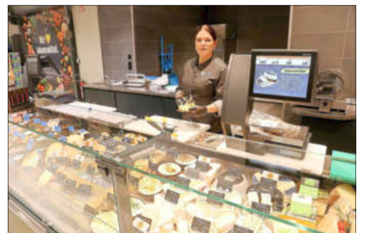
Die Frischetheken halten viele verschiedene Sorten Fleisch, Wurst, Käse und Fisch bereit.