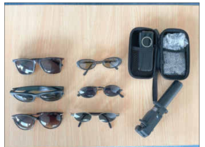
Die Polizei sucht die rechtmäßigen Eigentümer dieser sechs Sonnenbrillen, eines Alkotester und eines Selfiestick.

Bislang konnten keine Anhaltspunkte zu den rechtmäßigen Eigentümern der sichergestellten Gegenstände erlangt werden. Weil die Beamten nicht ausschließen, dass es sich um Beute aus Straftaten handelt, wenden sich die Ermittlerinnen und Ermittler des Rüsselsheimer Kriminalkommissariats mit einem Bild der Gegenstände an die Öffentlichkeit und fragen: Wer erkennt sein Eigentum wieder oder kann Hinweise zu den rechtmäßigen Besitzern und Besitzern geben? Bei den abgebildeten Gegenständen handelt es sich um sechs Sonnenbrillen, unter anderem der Marken RayBan und Otto Kern, einen Alkotester der Marke „Uwelliky“ und einen Huawei-Selfiestick. Die Polizei ist unter Telefon 06142 6960 zu erreichen. (ots)