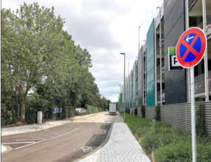
Das bisher bestehende Halteverbot wird ausgeweitet

Parkregelungen in der Straße „Am Südpark“, da für den Durchfahrtsverkehr mit großen LKW die vollständige Fahrbahnbreite benötigt wird. Das bislang auf den Bereich bis zur Zufahrt des Parkhauses „Platzhirsch“ beschränkte Halteverbot wird nun bis zur Zufahrt zum Anglerheim erweitert. Diese Maßnahme soll gewährleisten, dass der Verkehr reibungslos fließen kann und die Sicherheit für alle Verkehrsteilnehmer verbessert wird. Die bisher gültige 1-Stunden-Parkregelung für LKW entfällt mit der Erweiterung des Halteverbots vollständig. (iy/sb)