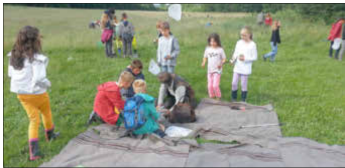
In idyllischem Umfeld spielen sich die Ferienlager in Ober-Seemen ab.

Die Teilnahmegebühr beträgt 80 Euro, hierin sind die Kosten für die An- und Abreise, Unterkunft, Vollverpflegung, Programm und Betreuung enthalten. Bei finanziellen Engpässen bittet der Kreis um frühzeitige Kontaktaufnahme, da unter bestimmten Voraussetzungen die Teilnahmegebühr ermäßigt werden kann. Anmeldeschluss ist am 14. Juli 2023. Weitere Informationen sowie die erforderlichen Anmeldeunterlagen gibt es bei der Kreisjugendförderung Groß-Gerau, Frau Köppler, Telefon 06152 989-450, E-Mail jf@kreisgg.de oder unter http://www.kreisgg.de/kinderfreizeiten Telefonische Platzreservierungen sind nicht möglich. (KreisGG)