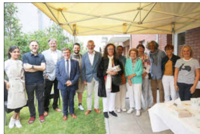
Die Delegation aus der Partnerstadt war vor der Platzeinweihung zu Gast in der Putia Nudelmanufaktur auf dem ENKA-Gelände.