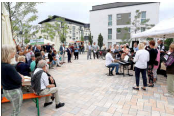
Der Volkschor Kelsterbach eröffnete die Feierlichkeiten.