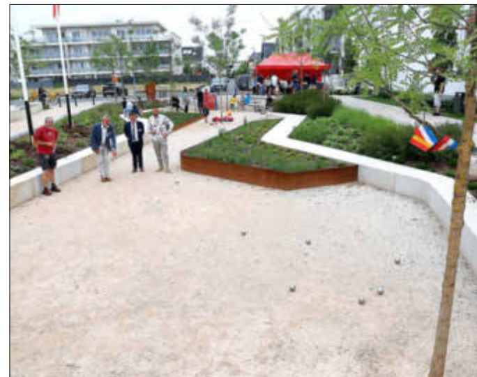
Im Senkgarten des Platzes wurden die ersten Boule-Kugeln geworfen.