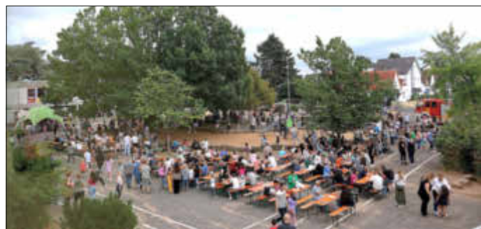
Eltern und Schüler feierten gemeinsam beim großen Sommerfest der KTS