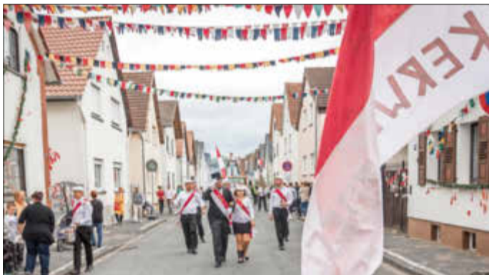
Immer wieder schön: Der Kelsterbacher Kerweumzug.

Die Kelsterbacher Kerb Die Kelsterbacher Kerb ist ein Traditionsfest, das immer am Wochenende des ersten Sonntags im September stattfindet. In diesem Jahr wird die Kelsterbacher Kern von Freitag, 1. September, bis einschließlich Montag, 4. September auf dem Schlossplatz im Unterdorf gefeiert. Hier erwartet die Besucher ein buntes Programm mit Live-Musik im Festzelt, diversen Fahrgeschäften für Groß und Klein sowie einem gastronomischen Angebot an verschiedenen Buden und im Festzelt. (ka)