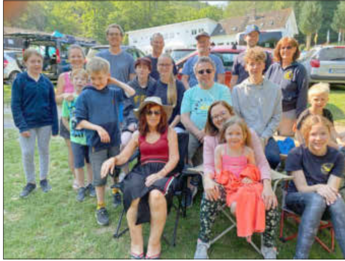
Die Teilnehmer des Kanu-Club an der Übungsfahrt

Das lange Wochenende um Fronleichnam verbrachten 18 Mitglieder des Kanu-Club Kelsterbach zur diesjährigen Trainings- und Jugendfahrt am Edersee. Die größte Herausforderung stellte sich bereits nach der Ankunft auf dem Campingplatz mit der Frage: „Wie baut man nochmal die Zelte auf?“ Auch wenn der Aufbau nach drei Jahren Pause nicht so leicht von der Hand ging, standen schon bald alle Zelte auf der Wiese und bei bereits hochsommerlichen Temperaturen lud der See zu einer Abkühlung ein.