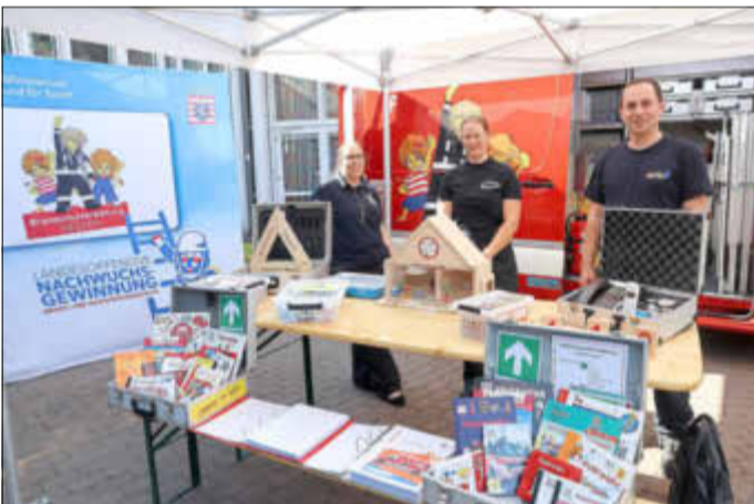
Das Brandschutzerziehungsmobil ist für die Arbeit mit Kindern bestens ausgestattet.

Letzterem wollte Staatssekretär Sauer nicht beipflichten, er setzt auf Freiwilligkeit, denn eine Dienstpflicht sei nicht praktikabel und Freiwilligkeit funktioniere besser. Wichtig sei es, neue Formate zu finden wie das freiwillige soziale Jahr, sagte Sauer. Für die Motivation der im Brand- und Katastrophenschutz Aktiven seien die Rahmenbedingungen bedeutsam, Anerkennung und Wertschätzung seien Begriffe, die mit Leben erfüllt werden müssten. (wö)