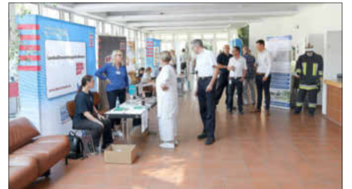
Im Foyer des Fritz-Treutel-Hauses hielten zahlreiche Stände der Organisationen des Brand- und Katastrophenschutzes Infomaterial bereit.