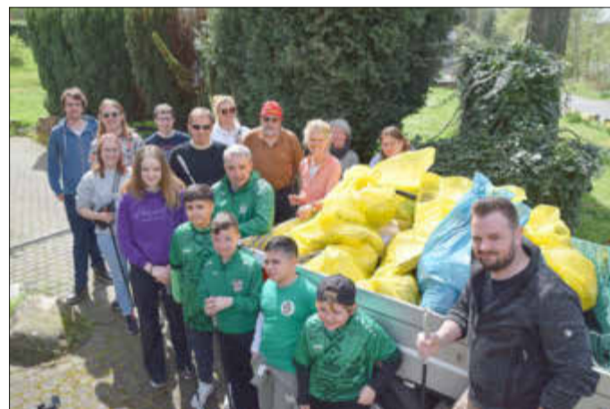
Das Endergebnis: Eine ganz Wagenladung voller Müllsäcke sammeln die freiwilligen Helfer. Vor allem die Kinder des BSC hatten viel zu tun.

schöne Orte, an denen es sich wunderbar spazieren gehen und entspannen lässt. Leider trübt immer wieder jede Menge rücksichtslos entsorgter Unrat das Erscheinungsbild beliebter Naherholungsorte. Wenn Menschen ihren Müll achtlos in die Natur