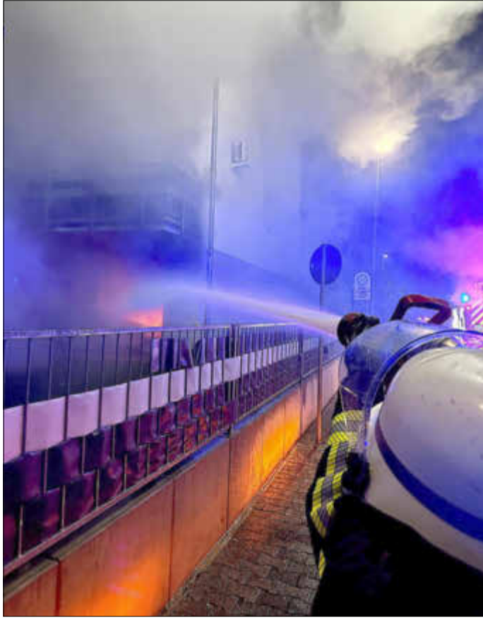
Feuerwehr bei der Brandbekämpfung.

Am vergangenen Freitagmorgen, einem dreistöckigen Reihenhauses gegen vier Uhr, ist in der Kelsterbacher Straße „Mainblick“ in einem dreistöckigen Reihenhauses ein Feuer ausgebrochen. Die Bewohner des Hauses selbst