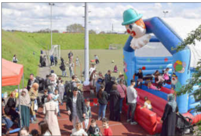
Die Hüpfburg war bei den jungen Besuchern des Festes sehr beliebt.