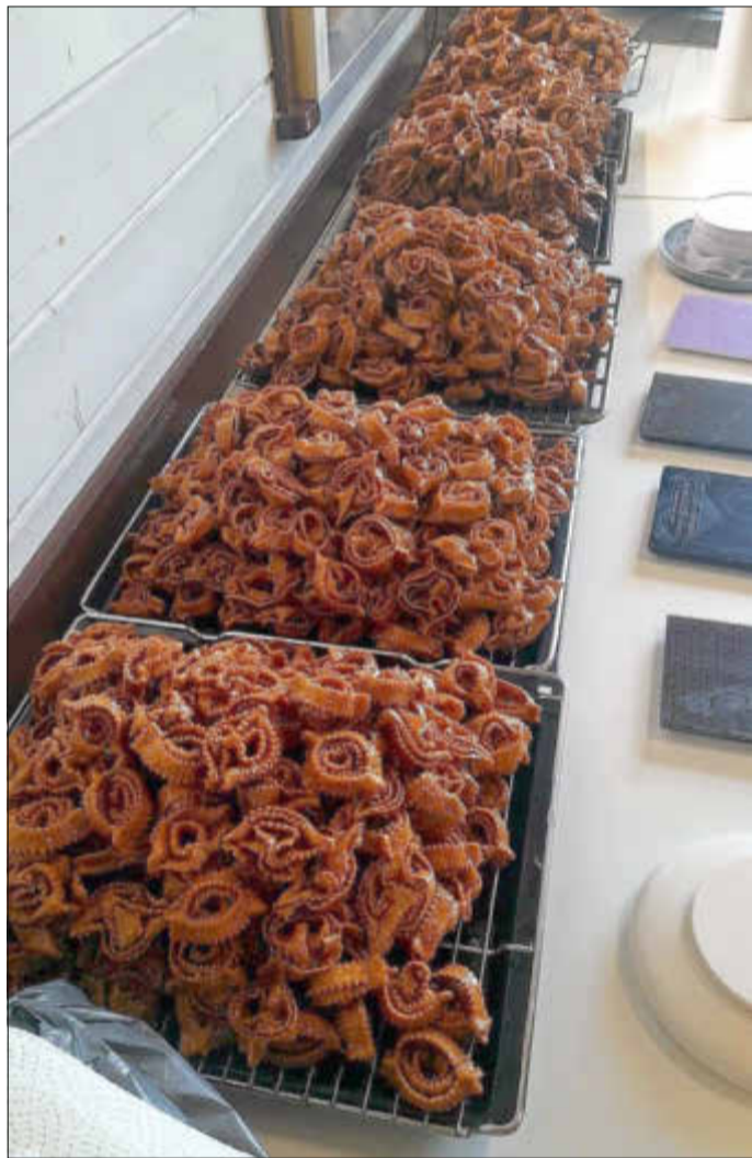
Die süße Köstlichkeit vor der Portionierung

Der Verkauf fand an dem Samstag vor Ramadanbeginn um 18 Uhr statt und der Ansturm war enorm! Trotz Vorbereitungen Wochen im Vorfeld und Backaktion am Freitag bis in den späten Abend sowie Samstag seit der Früh, geleistet von 20 bis 30 Helferinnen, war das Gebäck innerhalb von einer halben Stunde so gut wie ausverkauft. Die letzten Käufer/innen haben geduldig auf die Chebakia gewartet, die in der Küche noch gebacken wurden. Frischer geht es kaum.