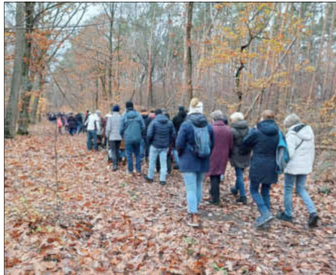
„Spaziergang zur Märchenwiese“