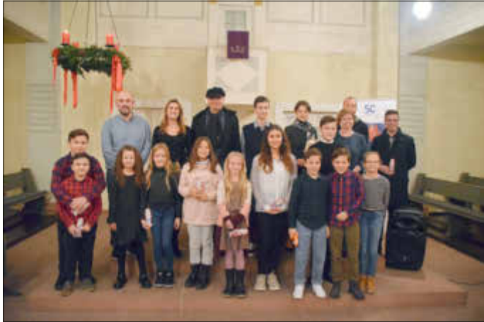
Stolze Musikschüler und Dozenten nach dem Adventskonzert der Musikschule in der St. Martinsgemeinde