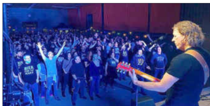
350 begeisterte Rockfans in der Mehrzweckhalle Nord

ziger rüberzubringen. Dabei wird Brian Adams „Summer of 69“ zu einer recht frivolen Rückblende, die eine bestimmte Maßnahme erklärlich auf den Punkt bringt. Dazu gesellen sich noch Werke von „Papa Roach“ als Vorlage für ein dringendes Bedürfnis und Bon Jovis „Have a nice day“ in malerischer Abwandlung. Wenig verwunderlich, dass tanzende und jubelnde Gäste für ein Stimmungsbild sorgten, das lange vermisst wurde. Die Schnaaken zeigten sich nachhaltig begeistert, 35 fleißige Helfer freuten sich über 350-fachen Zuspruch. Heiko Langelotz resümierte: „Endlich hatten wir wieder Spaß bei perfekter Stimmung. Dazu super Sound, keine Aussetzer und kein Defekt, nur Rock'n'Roll“. (gw)