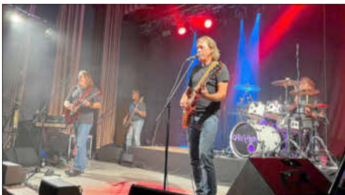
„live und laut“ on stage: die Quietschboys aus Frankfurt