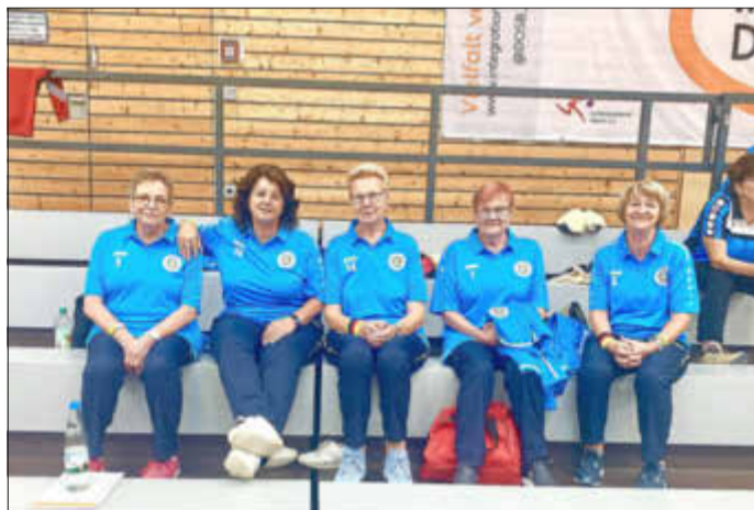
Die Damen der DM-22 freuten sich über den 5. Platz

Dass die Bosselgruppe des BSC-47 Kelsterbach nicht nur mit großem Engagement den Bossel schwingen kann, bewies sie am Freitag, den 25. November. Um 18:00 Uhr traf sich die gesamte Mannschaft im Lokal Auszeit, um ausgelassen zu feiern. Natürlich blieb es nicht aus, die Ereignisse des Jahres 2022 noch einmal Revue passieren zu lassen. Mit viel Gelächter wurde auch das eine und andere lustige Erlebnis aus den vielen Turnieren der letzten 10 Jahren ins Gedächtnis gerufen.