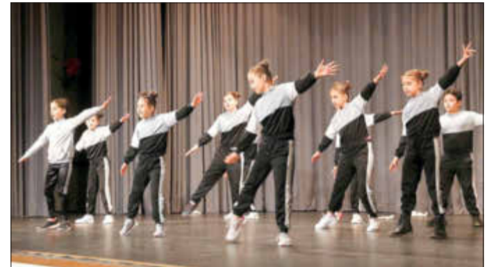
Die Gruppe „Hip Hop 4 Kids“ zeigte coole Tänze.

zeugen und das ein oder andere Mal zum Schunkeln zu animieren. Der Schlager singende Entertainer übernahm auch die Moderation der Bingorunde, bei der es Eintrittskarten für das Sport- und Wellnessbad, Kelsterbach-Bembel und Pralinen zu gewinnen gab.