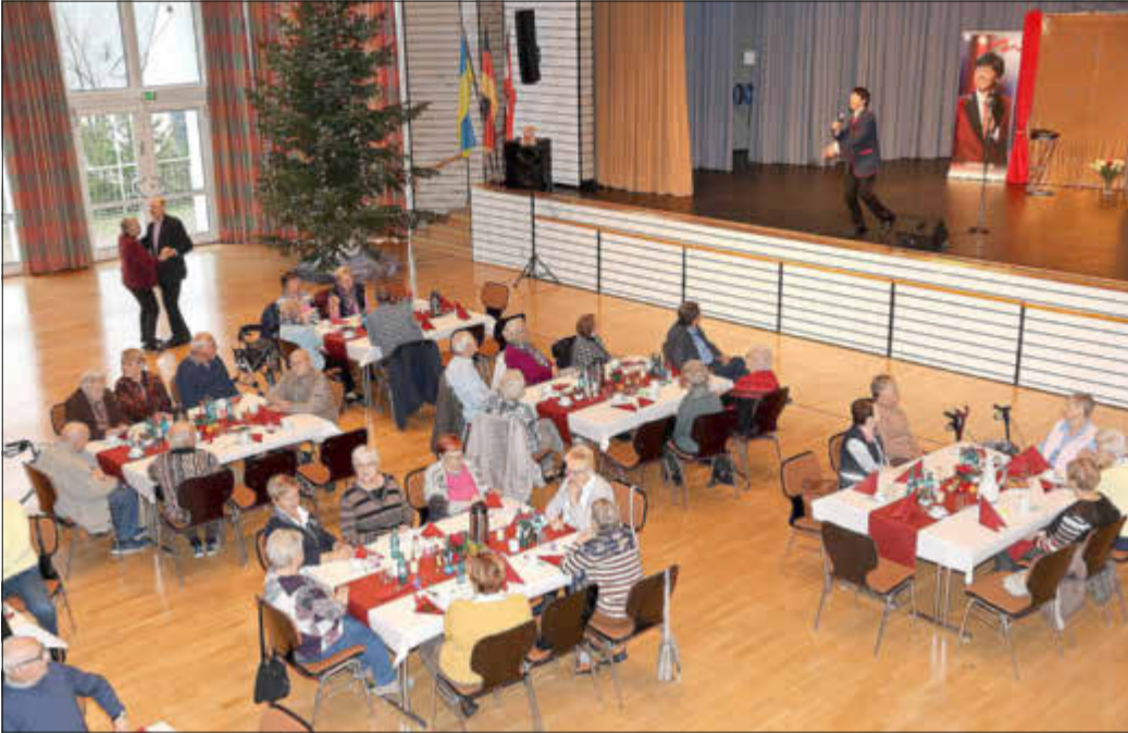
Adventscafé im Bürgersaal