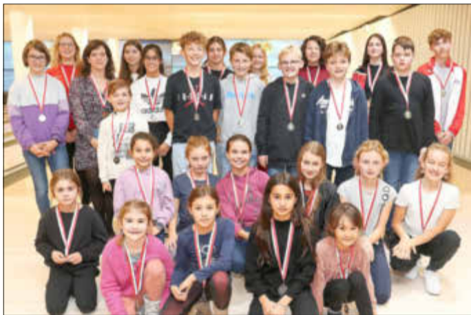
Die Gruppe der mit Silber- und Goldmedaillen geehrten Jugendsportlerinnen und Sportler.

Dass Kelsterbach eine sportbegeisterte Stadt ist, erweist sich jedes Jahr aufs Neue bei der städtischen Ehrung der Sportlerinnen und Sportler, die in großer Zahl Erfolge von der Kreis- bis hinauf zur Bundesebene oder auch auf internationalem Parkett errungen haben. Die Erwachsenen erhalten ihre Auszeichnungen im Rahmen des städtischen Ehrenabends, für die Kinder und Jugendlichen gibt es eine eigene Veranstaltung, die Jugendsportlererehrung. Diese fand Ende November im städtischen Kegel- und Bowlingcenter statt. Bevor die Medaillen und Plaketten für in den Jahren 2021/22 errungene Erfolge verteilt wurden, durften die Kinder und Jugendlichen aber erst einmal eine Runde bowlen, was sie mit Begeisterung taten. Die Moderation des Abends lag in den bewährten Händen