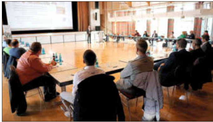
Rund 25 Unternehmerinnen und Unternehmer waren zum Mittagstreffen der Wirtschaftsförderung gekommen.

Oftmals herrsche Angst davor, etwas am laufenden System zu ändern, um dessen Zusammenbruch nicht herbeizuführen. Die Konsequenz sei, dass man gleichzeitig kühle und heize, weil einzelne Systeme gegeneinander arbeiteten. Auch „zu warten, bis etwas kaputt ist“, sei nicht die energieeffizienteste Lösung, so Mayer. „Denn die Energie, die Sie verbrauchen, ist weg.“ An seiner Energieeffizienz zu arbeiten sei dagegen „eine Möglichkeit, Unternehmen in der Zukunft konkurrenzfähig am Markt zu halten“.