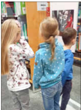
Gespannt betrachteten die Kinder die Illustrationen.

Wer erinnert sich nicht an die heiteren oder beunruhigenden, rätselhaften oder verträumten Illustrationen, die in den Märchenbüchern der Kindheit abgebildet waren? Zwischen den Buchdeckeln älterer und jüngerer Ausgaben der Kinder- und Hausmärchen der Brüder Grimm oder den Bilderbüchern zu einzelnen Märchen verbergen sich Bilder, die sich tief in das Gedächtnis ganzer Generationen von Kindern eingegraben haben.