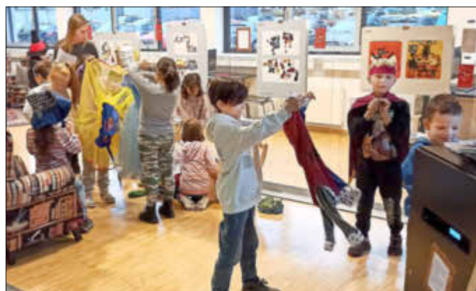
Mittels der Verkleidungskiste verwandelten sich die Kinder in Märchenfiguren.

hatte die Schau durch viele Mitmach-Aktionen erweitert. Die Kinder konnten Märchenbücher lesen und hören, sich das Märchen vom „Dicken, fetten Pfannekuchen“ in einem Kamishibai - einem japanischen Papiertheater - ansehen, sich mit Hilfe der Verkleidungskiste in Märchenfiguren verwandeln, an Tischen Märchen-Brettspiele spielen und das Wissen bei einem Quiz erproben. Zum Andenken an den zauberhaften Besuch durfte sich jedes Schulkind aus einer