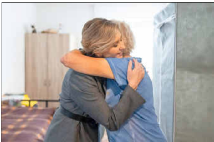
Die persönlichen Begegnungen waren teils recht emotional.

Am vergangenen Freitag besuchte Olena Selenska, die Ehefrau des ukrainischen Präsidenten Wolodymyr Selenskyj, den Hessischen Landtag und