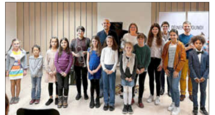
Die Klavier- und Trompetenschülerinnen und -schüler.