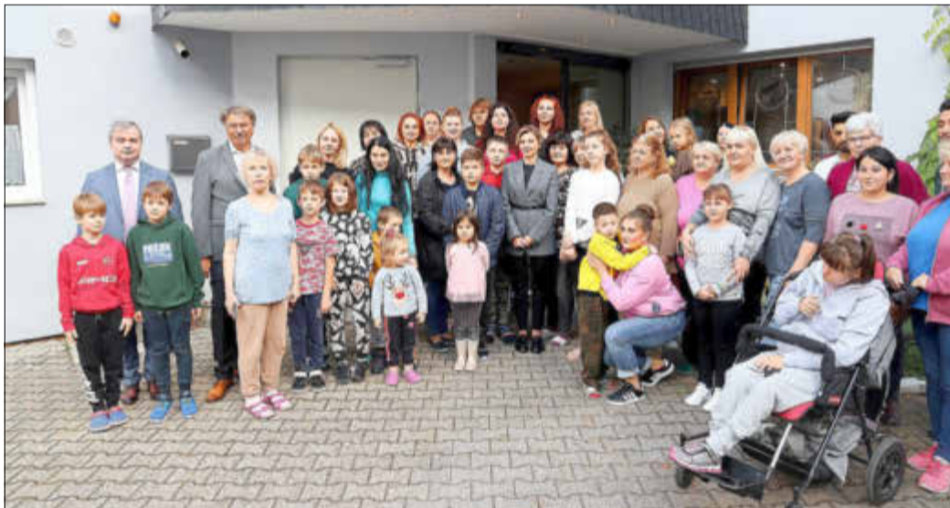
Gruppenfoto mit der First Lady.