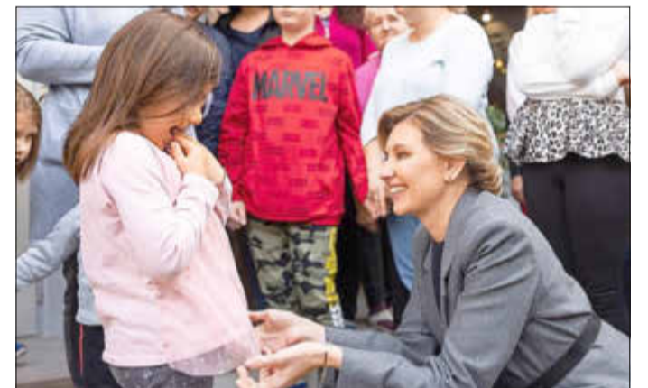
Die First Lady der Ukraine begegnete ihren Landsleuten herzlich und aufgeschlossen.