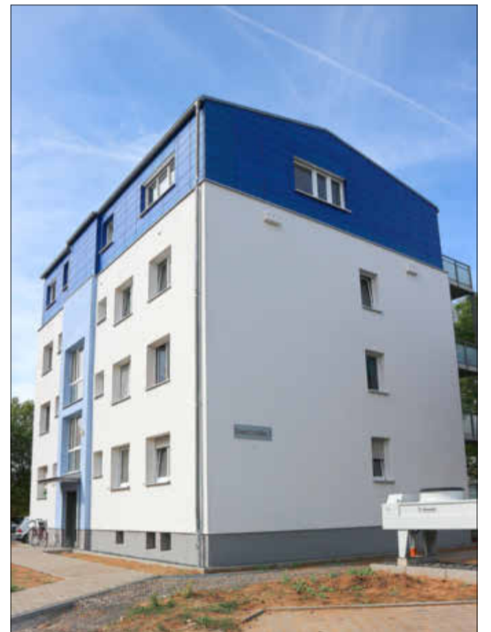
Strahlend blau wie der Himmel: das Haus in der Dreieichstraße 5. Gut zu sehen sind die Einfluglöcher für Fledermäuse links und die Brutkästen für Mauersegler rechts. Vorne im Bild die Luft-Wärme-Pumpe