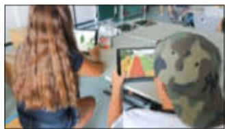
Alessia und Gianluca konstruieren unter anderem das Café.

Jugendliche nahmen an Workshop zur Neugestaltung des Südparks teil