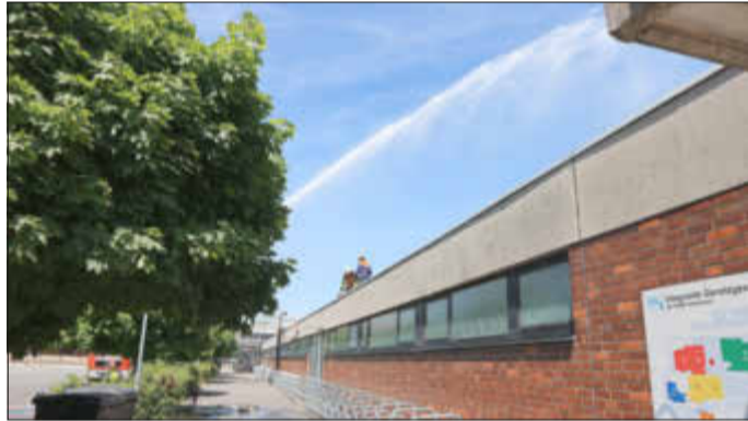
Erfolgreiche Rettung eines Dummies vom Dach der IGS