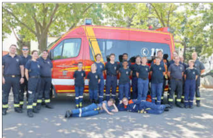
Die versammelte Mannschaft am Ende des 32-Stunden-Einsatzes