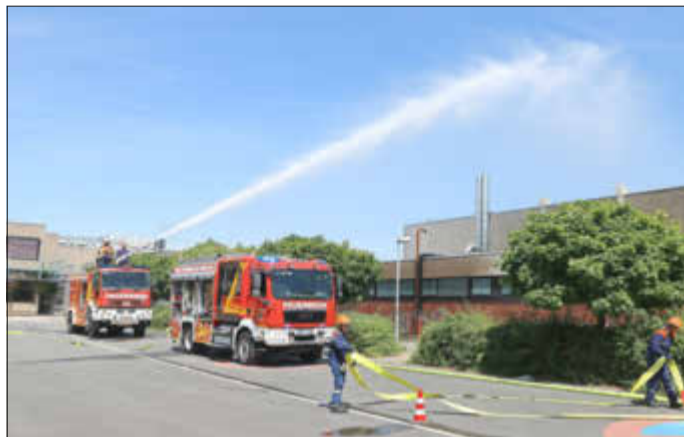
Mit dem Wasserwerfer wird der Rauch großflächig bekämpft