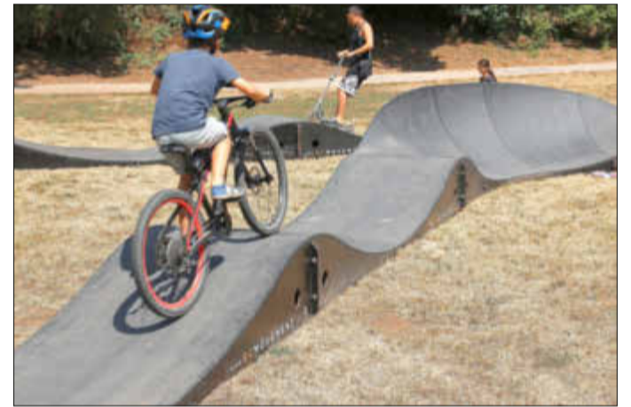
Der Pumptrack kann mit Fahrrädern, Tretrollern und vielem mehr befahren werden.