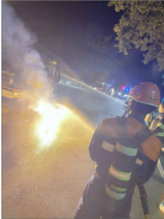
Einsatz bei Nacht