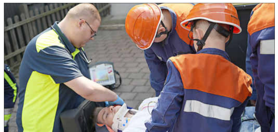
Zusammen mit dem Veritas-Rettungsdienst wird die verletzte Person versorgt