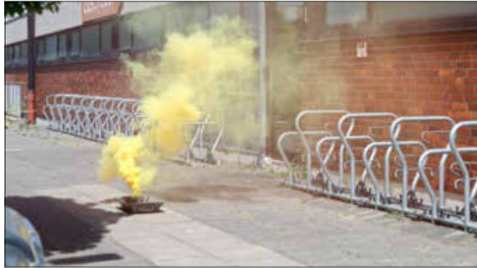
Einer der zu löschenden Rauchtöpfe an der IGS