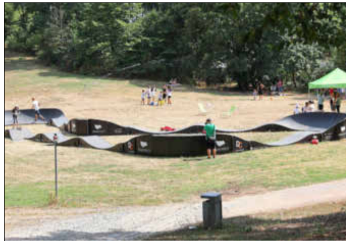
Der Pumptrack ist ein 64 Meter langer Rundkurs.

tulierte den glücklichen Gewinnerinnen und Gewinnern und übereichte ihnen die Preise. Der Südpark, sagte Linnert, werde von der Bevölkerung sehr gut angenommen und häufig zum Entspannen und zum Zusammensitzen in Gruppen und mit der Familie genutzt. Manchmal gebe es aber auch Probleme, beispielsweise mit dem Grillen, derer sich die Stadtverwaltung dann annehmen müsse. Zusammen mit dem angrenzenden See wolle die Stadt nun im Südpark eine Verbesserung schaffen. Dazu habe der Wettbewerb die Grundlage gelegt, in einer Lenkungsgruppe und mittels Bürgerbeteiligung solle das Projekt nun weiterentwickelt werden, so Linnert. „Was wir hier in Angriff nehmen, braucht Zeit“, gab der Erste Stadtrat indes zu bedenken. Linnert sagte auch, man wolle nun schauen, wie gut der Pumptrack in den kommenden fünf Wochen angenommen werde, vielleicht könne später wieder so eine Anlage im Südpark platziert werden. (wö)