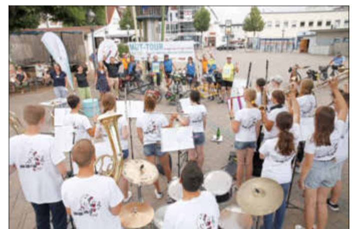
Teilnehmer/-innen der MUT-Tour wurden bei ihrem Stopp auf dem Groß-Gerauer Marktplatz vom Orchester „Brass & Co“ der Prälat-Diehl-Schule begrüßt.