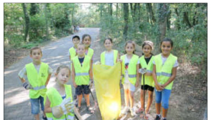
Mission Müll: Die gelben Engel der anderen Art