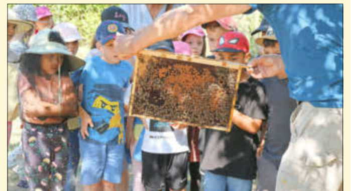
Hier tummeln sich fleißige Arbeiterinnen an der Wabe.