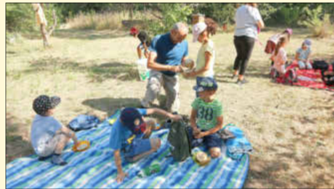
Beim gemeinsamen Frühstück werden die Kinder schon einmal an das Thema Bienen herangeführt.

Nach dieser Fragerunde kam der spannendste Teil, das Begutachten eines Bienenstocks von innen. Hierfür räucherte der Hobbyimker einen seiner Bienenstöcke ein, um die Bienen am Herumschwirren zu hindern, als er die Klappe öffnete. Die Kinder verfolgten alles mit großen Augen und viele trauten sich dicht heran an den Bienenstock. So konnten sie hautnah sehen, wie die Waben innerhalb der Holzrahmen des künstlichen Bienenstocks von den Bienen gebaut werden. Sie sahen den Kasten für den Honig, den Kasten, in dem die Brut großgezogen wird, und durften mit dem Finger Honig direkt aus der Wabe naschen. Die Begeisterung war groß und somit ist das Wissen über und die Akzeptanz für die Bienen sicher um ein großes Stück gewachsen. (Text und Bilder ana)