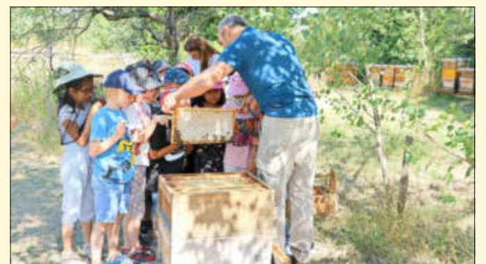
Honig direkt aus der Wabe schlecken, für viele Kinder das Highlight des Tages.