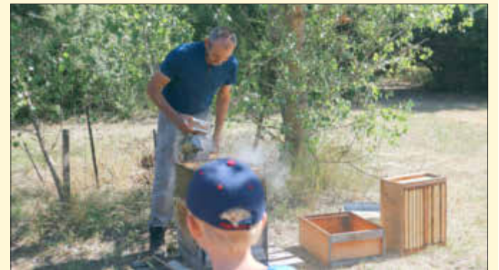
Zuerst wird der Bienenstock ausgeräuchert.