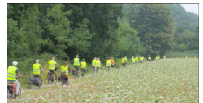
Radtour ins Grüne