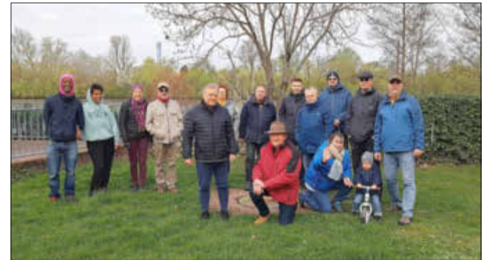
Das Bild zeigt die Wanderer vor dem Start