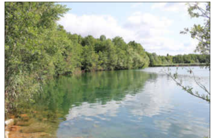
Der Kelsterbacher Mönchwaldsee dient nicht nur der Erholung der Menschen, er ist vor allem auch ein wertvolles und geschütztes Refugium für allerlei Wasservögel.

Alle Personen erhalten demnächst einen Bußgeldbescheid der Unteren Naturschutzbehörde. Die Höhe liegt bei mindestens 120 Euro. Falls Vorsatz zu unterstellen ist – etwa, wenn gut sichtbare Verbotsschilder ignoriert wurden – kann auch das