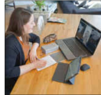
Statt Hausbesuche zu machen, schreibt eine Zeugin Jehovas einen Brief

Die Glaubensgemeinde führt ihre Gottesdienste per Videokonferenz durch. Aber auch für private Treffen und gemeinsame Unternehmungen nutzen die Glaubensangehörigen gängige Meeting-Apps - und das generationsübergreifend. Da sie auf die bekannten Hausbesuche verzichten, schreiben ebenfalls viele Gemeindeglieder freundliche und oft liebevoll gestaltete Briefe an Menschen in ihrer Umgebung, um mit ihnen etwas Positives zu teilen.