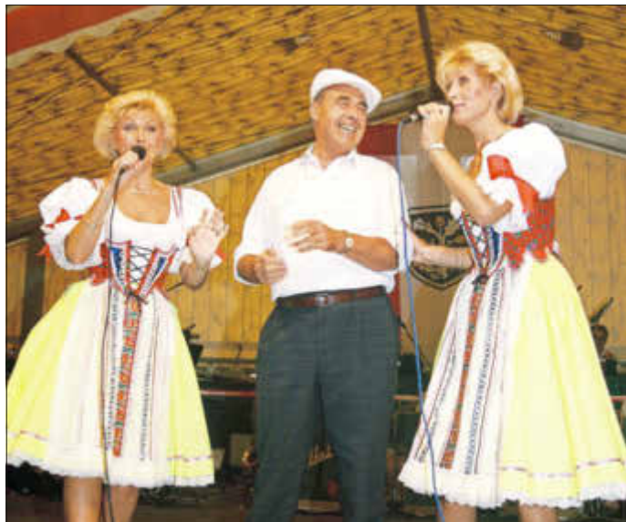
Bei der Kerb charmant umringt.