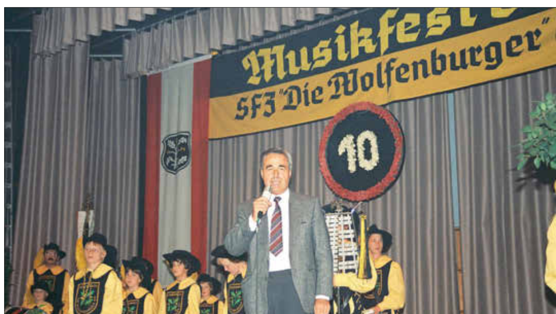
Mann der Vereine, Ehrenvorsitzender des Vereinsringes.