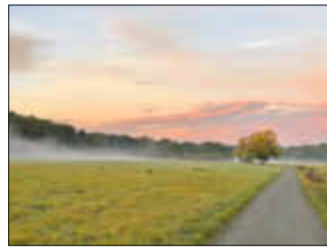
Morgendliches Naturerlebnis beim Walken (Schwanheimer Wiesen)

und sammeln uns. Walking ist ein sanfter Ausdauersport, tut Herz und Kreislauf gut und ist für jedes Alter geeignet. Lust auf eine wunderschöne morgendliche Walking-Runde im Schwanheimer Wald?