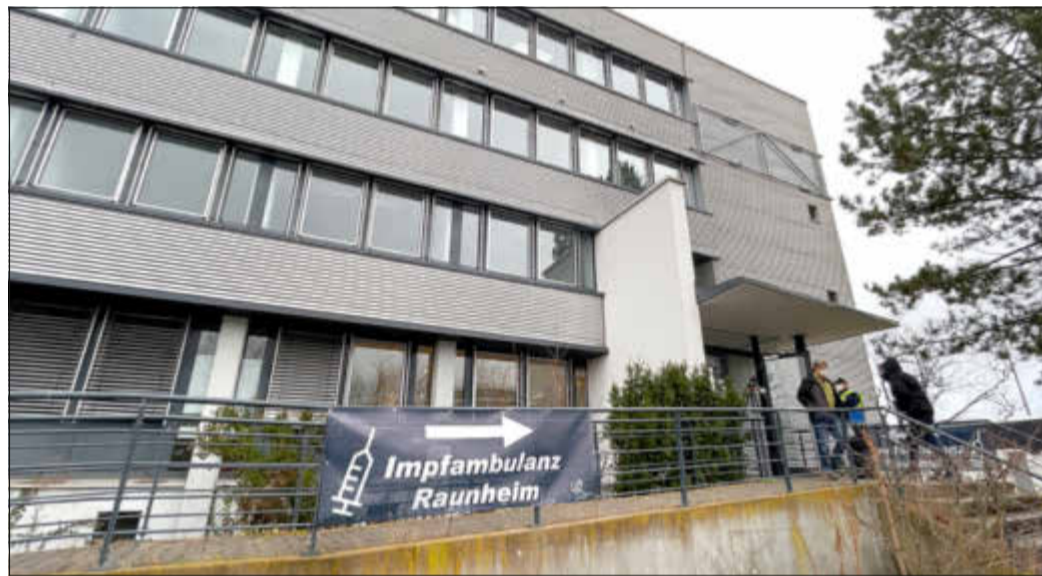
Seit Anfang des Jahres gibt es zwei weitere Impfambulanzen im Kreis Groß-Gerau. Eine davon befindet sich in der Kelsterbacher Straße 38 in Raunheim.

Alle Informationen zum Thema Impfen finden sich auf der Homepage des Kreises www.kreisgg.de/impfung . Dort geht es auch zur Terminplattform. Anmeldungen zum Boostern sind zudem über die Rufnummer 06152 989989 möglich. Erst- und Zweitimpfungen sind jederzeit ohne Anmeldung möglich.