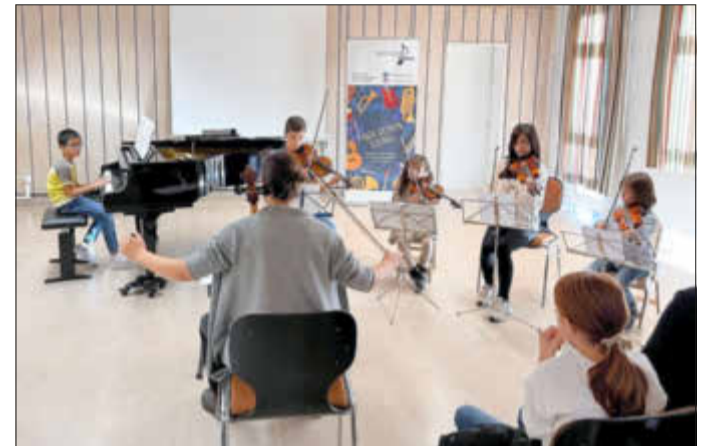
Das neu gegründete Streichensemble hatte seinen ersten Auftritt.