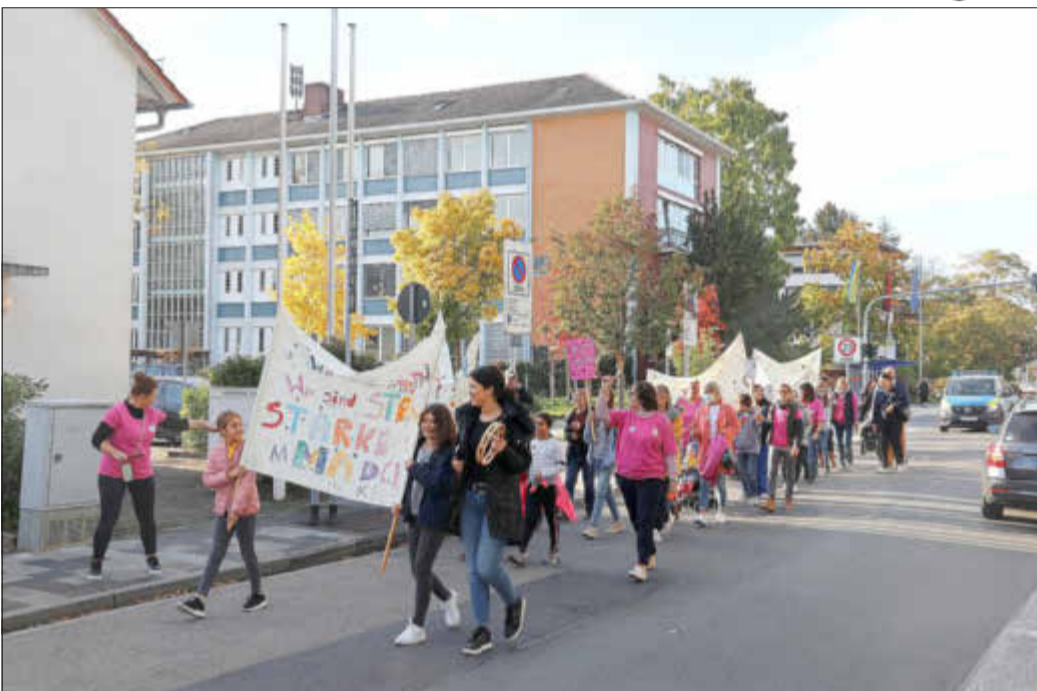
Über die Mörfelder Straße zogen die Demonstrantinnen am Rathaus vorbei.