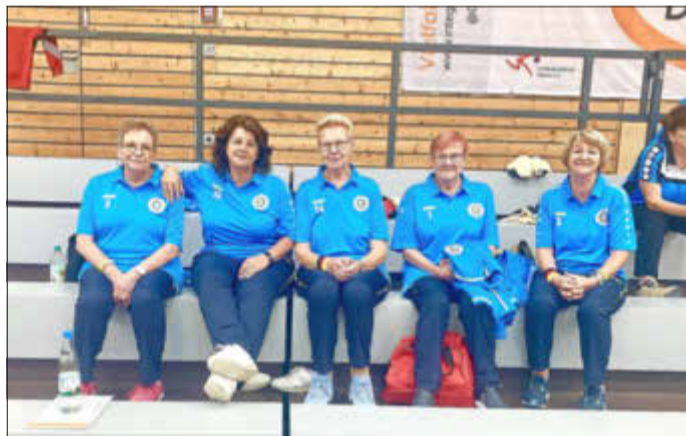
die Damen - Mannschaft

Insgesamt mussten die Bosslerinnen 11 Spiele absolvieren.